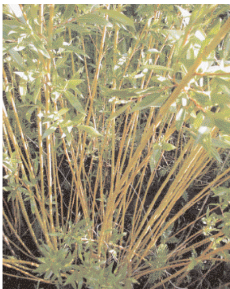
Figur 3. Salix Alba Chermesina . Træagtig pil med utroligt flot løv. Meget flot bark, der flammer gulligt/rødt om vinteren. Helt unik pil., særligt om vinteren. Bliver op til 20 m højt, men kan holdes nede som busk.