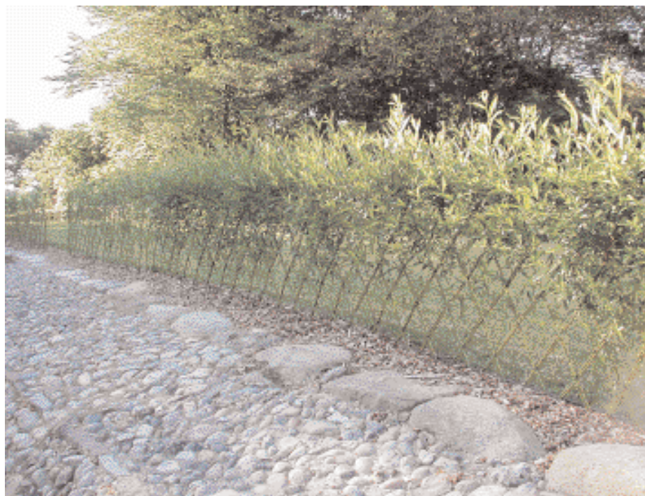
Figur 4. Færdigflettet harlekinhegn, 3 mdr. efter etablering.

rankhed, og blot relativt afkvistede. Hensigtsmæssigt, hvis de kan plantes med brug af plantespyd.