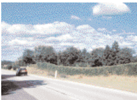
Figur 7. Levende støjskærm i pil. Støjskærm monteret ved Hørsholm Golf ud mod Hillerødmotorvejen.

der giver en begrænset holdbarhed på hegnene. Typisk 8-10 år. Med en kraftig opdimensionering i materialevalget har PileByg udviklet et tørt flettet pilehegn, der kan måle sig med stærke plankeværksløsninger. Levetiden på et færdigflettet pilehegn i stål, akacie og 2 år gamle pilestammer er således forventeligt 20 år (fig. 6).