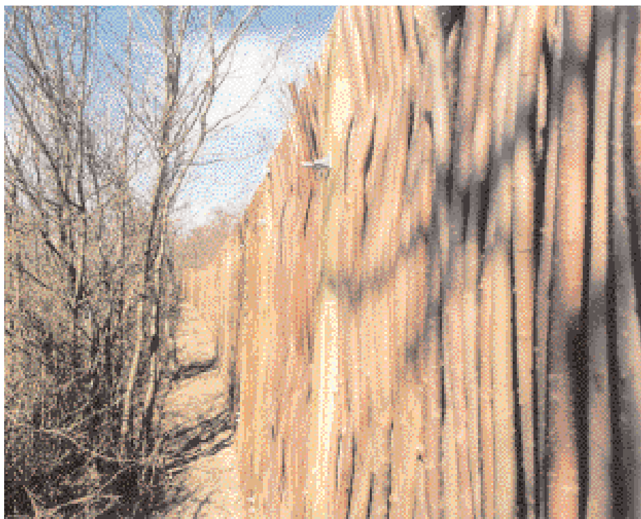
Figur 8. Støjskærm i tørt flettet pil. Støjskærm monteret ved Motorring 3 i Brøndby Kommune.

Pil bliver også anvendt i design af det tunge vejudstyr. Støjskærme i pil giver grøn beplantning og støjdemping i en og samme løsning. Om det er skærme udført i levende eller tørt pil er produktionskravene til pilene de samme. Selve skærmkonstruktionen er en historie for sig selv; bygget op som en sandwich med facader i pil, der indrammer en kerne af stenuld. I de tidlige støjskærme af levende pil, var der tale om egentlig beplantede skærme. Pilen blev plantet ind i en skærmkerne af eksempelvis jord. Kernens mobilitet og manglende stabilitet over årene, herunder også beplantningens afhængighed af kunstvanding, medførte imidlertid, at det først var med den nye skærmtype, bygget op omkring stenuldkernen – at man fik en stærk og holdbar konstruktion med den forventelige levetid