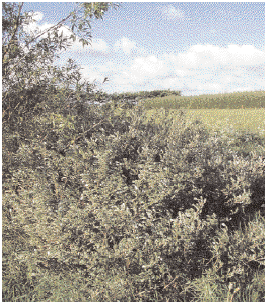
Figur 1. Salix Repens . Tørkeresistent pil fra vestkysten, med et flot sølvskaer i løvet. Salttolerant. Meget tæt og busket med en typisk højde af ca. 1,5 meter.

Pil kan opformeres og udplantes som stik-