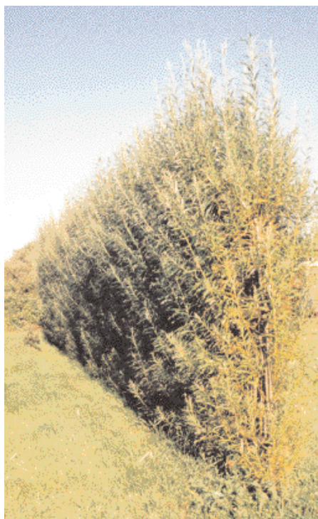
Figur 5. Det Grønne element i levende pil, et levende alternativ til plankeværket. Her 3 mdr. efter plantning. Graffiti bliver ikke et problem!

Fælles for de levende pilehegn er, at de er mere plejekrævende end pil udplantet som stiklinger. Typisk vil de lange stokke kræve vanding i etableringsårene for at opnå en tilfredsstillende skudsætning op ad hele hegn. Ligeledes vil en styning i lighed med hækklipping være nødvendigt for at holde hegnene flotte. Fordelen er imidlertid, at man opnår en grøn af-