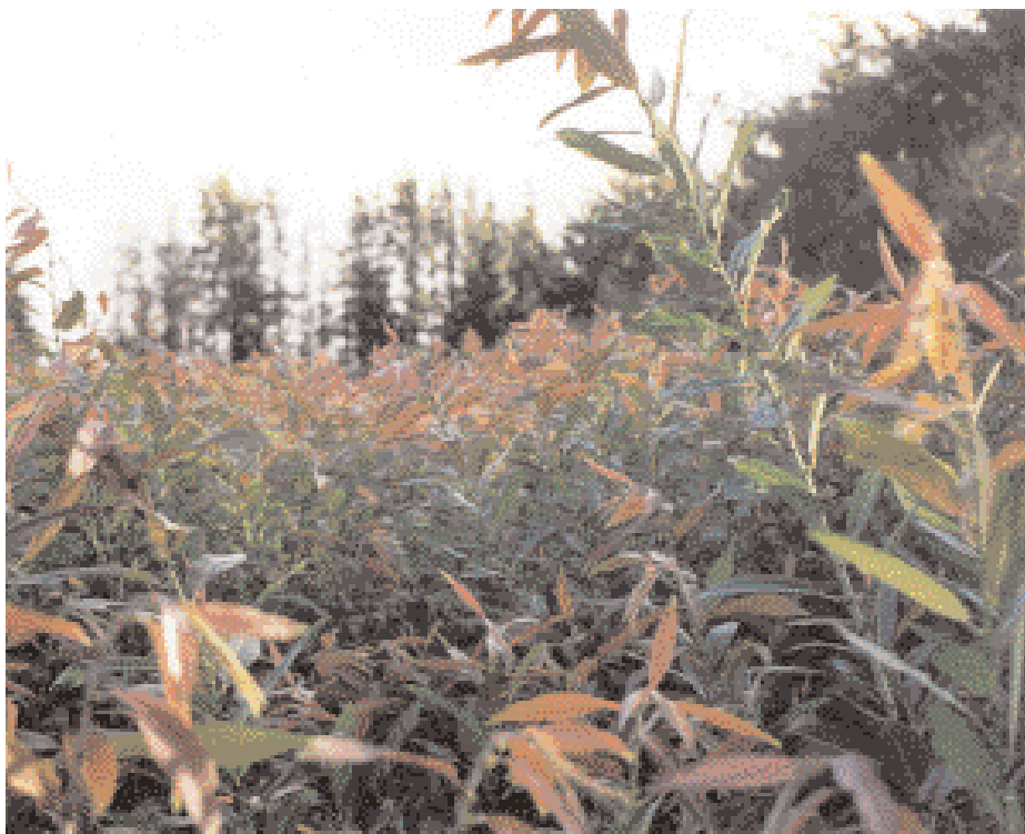
Figur 2. Salix Americana . Flot, busket pil med et stærkt tofarvet, glansfuldt løv, bordeauxrød og grøn. God dækkeevne. Bliver maks. ca. 2-3 m. høj.

linger (uden rodnet), og der anvendes typisk 1-årige skud. Det reducerer udgiften ved udplantning betydeligt sammenholdt med etablering af eksempelvis flerårige rodede træer. Den enkle opformeringsteknik er imidlertid også en af de væsentligste grunde til, at man bør være særligt opmærksom på kvaliteten af stiklingerne. Der opnås kun et tilfredsstillende resultat, såfremt kravene til produktion og levering af stiklingsmateriale overholdes.